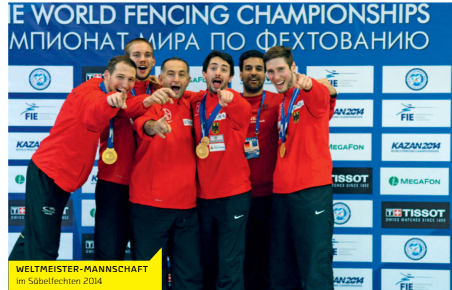
WELTMEISTER-MANNSCHAFT im Säbelfechten 2014