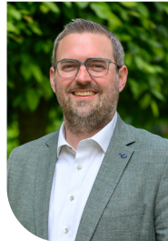
Erik Lierenfeld Bürgermeister der Stadt Dormagen

„Die Bertha-von-Suttner-Gesamtschule und das Norbert-Gymnasium Knechtsteden wurden 2013 vom Land gemeinsam als NRW-Sportschule anerkannt. 2023 folgte die Ernennung zur Eliteschule des Sports durch den Deutschen Olympischen Sportbund. Dormagen profiliert sich damit weiter als Sportstadt und als einer der wichtigsten Sportstandorte landesweit. Diese Entscheidung hilft uns, die Grundlagen für eine weiterhin erfolgreiche Entwicklung des Leistungssports in unserer Stadt zu sichern.“